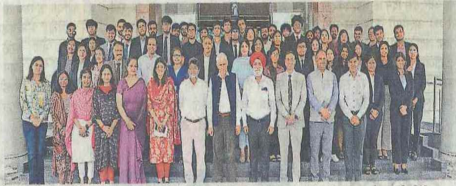
पटियाला में ला यूनिवर्सिटी में डायरेक्ट टैक्स कानूनों पर आयोजित सम्मेलन में शामिल होने वाले विषय विशेषज्ञ सो. ला यूनिवर्सिटी

उन्होंने इसके ऐतिहासिक संदर्भ और कृषि क्षेत्र को प्रत्यक्ष कर ढांचे में अधिक प्रभावी ढंग से एकीकृत करने के लिए भविष्य में सुधारों की गुंजाइश पर चर्चा की। उन्होंने इस बात पर