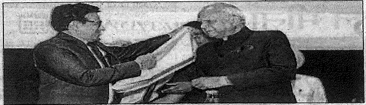
यूनिवर्सिटी में आयोजित कान्फ्रेंस के मौके पर पंजाब के राज्यपाल बनवारी लाल पुरोहित को सम्मानित करते अधिकारी।

उन्होंने राजा विक्रमादित्या और जहांगीर के दरबार की उदाहरणें सुनाई। वह वीरवार शाम को राजीव गांधी नेशनल ला यूनिवर्सिटी में आयोजित 3 दिवसीय अंतरराष्ट्रीय कान्फ्रेंस के उद्घाटन समागम को संबोधित कर रहे थे। राज्यपाल ने भारतीय न्याय प्रणाली पर चर्चा की