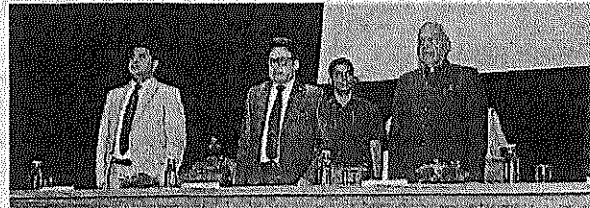
सम्मेलन की अध्यक्षता करते राज्य के राज्यपाल बनवारी लाल पुरोहित

जागरण संवाददाता, पटियाला : पंजाब के राज्यपाल बनवारी लाल पुरोहित ने सेंटर फॉर क्रिमिनोलॉजी, क्रिमिनल जस्टिस एंड विक्टिमोलॉजी (सीसीवी), राजीव गांधी नेशनल यूनिवर्सिटी ऑफ ला द्वारा आयोजित तीन दिवसीय अंतरराष्ट्रीय सम्मेलन (3-5 नवंबर 2022) सिक्योरिंग जस्टिस टू विक्टिम ऑफ क्राइम की अध्यक्षता की। पंजाब इंडियन सोसाइटी ऑफ विक्टिमोलॉजी (आईएसवी) और वर्ल्ड सोसाइटी ऑफ विक्टिमोलॉजी (डब्ल्यूएसवी) के सहयोग से अपराध के पीड़ितों के लिए न्याय की सुरक्षा पर इंडियन