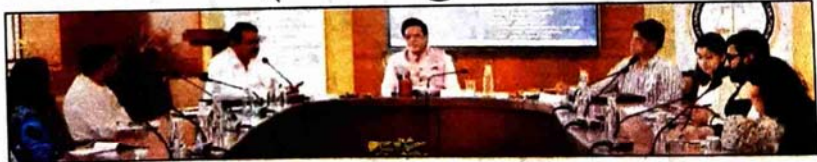
ਕਾਨੂੰਨੀ ਸਲਾਹ ਪਾਇਲਟ ਪ੍ਰਾਜੈਕਟ ਸ਼ੁਰੂ ਕਰਨ ਸਬੰਧੀ ਗੱਲਬਾਤ ਕਰਦੇ ਹੋਏ ਅਧਿਕਾਰੀ।